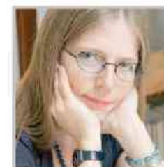
Mariapia Veladiano Con La vita accanto vince nel 2010

ne, l'editore perfetto per ciascuno di loro. E questo, per uno scrittore, è l'obiettivo più importante.